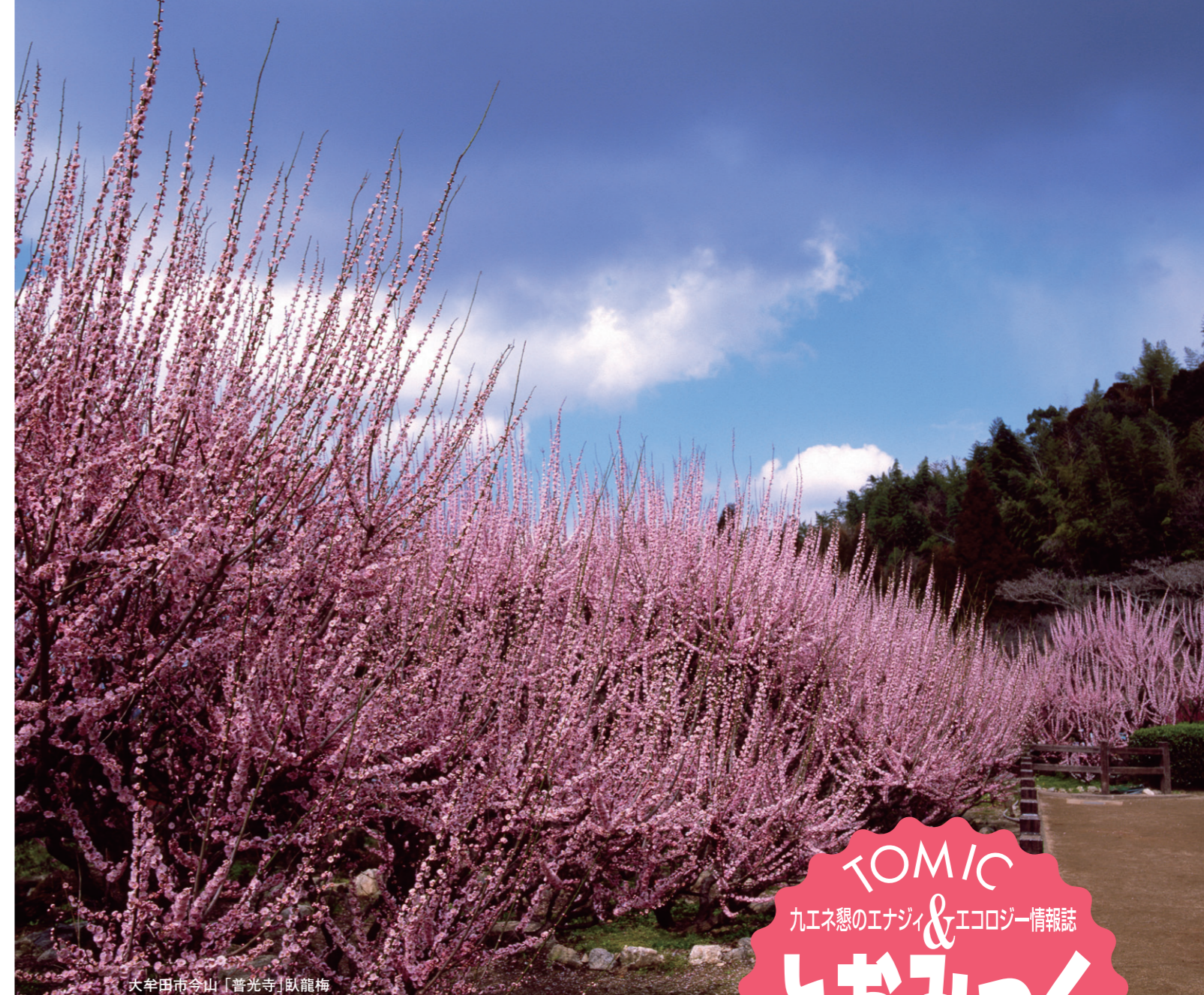
大牟田市今山「普光寺」臥龍梅